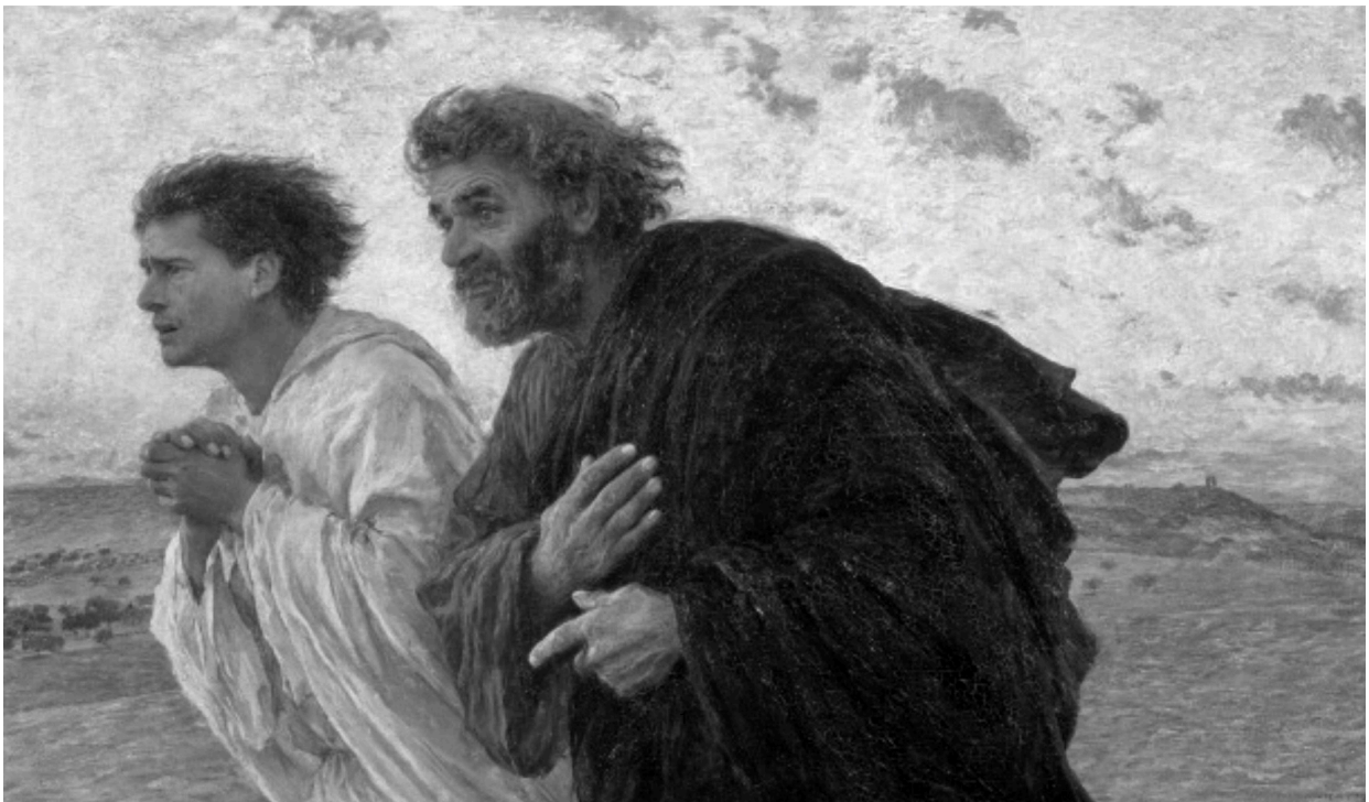
Die Jünger Petrus und Johannes laufen am Morgen der Auferstehung zur Grabstätte, Eugène Burnand/ Bridgeman Images

Dieses Gemälde zeigt uns Handeln und Bewegung—jetzt, früh, wie am Ostermorgen. Wir brauchen nicht darauf zu warten, bis wir sterbenskrank sind, um die Dinge der Ewigkeit ernst zu nehmen. Wir können jetzt die Freude dabei spüren, wie wir unsere Schritte beschleunigen, um ihm entgegen zu laufen. Und wir können unser Verlangen steigern, jetzt näher bei jener Ewigen Gegenwart zu leben; so kann er uns besser auf jedwede heiligende und komplexe Erfahrung vorbereiten, die uns erwartet.